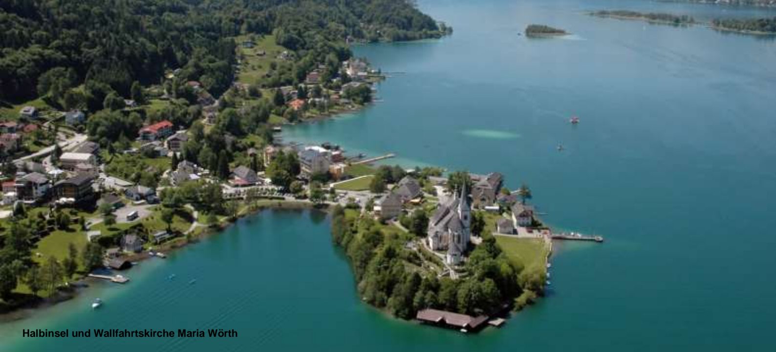
Halbinsel und Wallfahrtskirche Maria Wörth