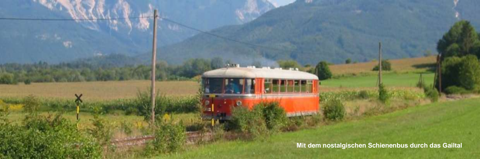
Mit dem nostalgischen Schienenbus durch das Gailtal