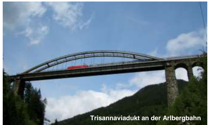
Trisannviadukt an der Arlbergbahn

Auch die Rückreise führt über besonders interessante Gebirgsstrecken! Vorerst fahren wir entlang der Drau nach Spittal an der Drau, dann weiter durch das Oberdrautal nach dem in Osttirol gelegenen Lienz. Entlang der hier noch jungen Drau geht es nach Sillian und über die Grenze nach Südtirol. Auf der linken Seite sehen wir die Dolomiten und es folgen die bekannten Orte Toblach und Bruneck. In Franzensfeste münden wir in die Hauptstrecke der Brennerbahn ein und reisen über den Brennerpass hinunter ins Inntal nach Innsbruck.