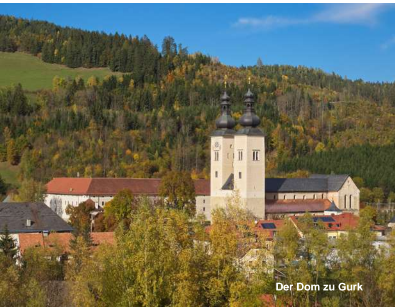
Der Dom zu Gurk

Dreistündige Wörtherseerundfahrt ab / bis Pörtschach