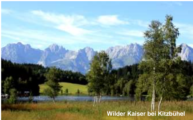
Wilder Kaiser bei Kitzbühel

Unsere Fahrt führt ab Lindau durch das malerische Allgäu und vorbei an München - Rosenheim - Kufstein nach Wörgl. Nun folgt die Salzburg - Tirolerbahn die uns durch die grossartigen Gebirge der Tiroler Alpen führt. Links sehen wir das Gebirge des "Wilden Kaiser" und rechts die Berge der Kitzbüheler Alpen. Es folgen die berühmten Ferienorte Kirchberg, Kitzbühel und St. Johann. Weiter geht es entlang den Leoganger Steinberge und über den Griessenpass ins Salzburgerland. Es folgt Zell am See und entlang der Salzach erreichen wir den Bahnknoten Schwarzach-St. Veit. Nun fahren wir über die spektakuläre Tauernbahn die uns nach Kärnten bringt.