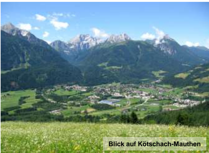
Blick auf Kötschach-Mauthen

Fahrt im nostalgischen Schienenbus von Pörtlach oder Villach auf der ÖBB Nebenstrecke durch das malerische Gailtal nach Kötschach-Mauthen. Mittagessen in einem Landgasthof. Carfahrt auf einer landschaftlich besonders interessanten Route zurück nach Villach oder Pörtlach. Diese Reise wird mit zwei Gruppen durchgeführt, wobei die zweite Gruppe die Reise in umgekehrter Richtung ausführt.