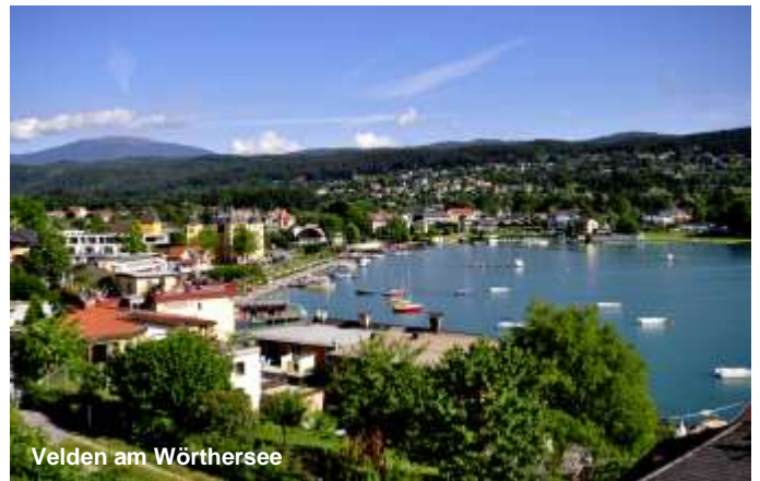
Velden am Wörthersee